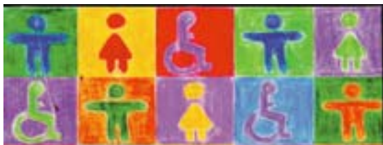
Disegno: Marina Wirlitsch, Anno europeo delle persone con disabilità 2003

Le persone con disabilità dovrebbero godere di un trattamento equo sul lavoro e quindi anche in materia di salute e sicurezza. La salute e la sicurezza non devono diventare una scusa per non assumere o per continuare a non assumere persone disabili. Inoltre, un luogo di lavoro che è accessibile e sicuro per i disabili è a maggior ragione più sicuro e più accessibile per tutti i dipendenti, clienti e visitatori. Le persone con disabilità sono coperte tanto dalla legislazione europea contro la discriminazione quanto da quella concernente la salute e la sicurezza sul lavoro. Tale legislazione, che gli Stati membri recepiscono nella legislazione e negli ordinamenti nazionali, dovrebbe essere applicata per facilitare l'occupazione di persone con disabilità e non per escluderle.