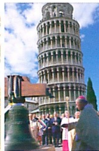
Torre di Pisa