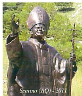
Scanno (AQ) - 2011

Il Museo Storico della Campana “Giovanni Paolo II” nasce nel 1997 presso la Fonderia Marinelli, operante in Agnone sin dal medioevo. Nel museo sono esposti studi, modelli, antichi attrezzi e calchi per la decorazione delle campane. Nel primo corridoio della “grande galleria” sono documentate origine, storia e tradizioni ad essa riferite ed è esposta la più vasta collezione al mondo di bronzi sacri tra cui è dato particolare rilievo alla cosiddetta “Campana dell'Anno Mille”. Il Museo conserva inoltre antichi documenti e testi rari come l'edizione olandese del 1664 del “De Tintinnabulis”, di Gerolamo Maggi, definita la Bibbia dell'arte campanaria.