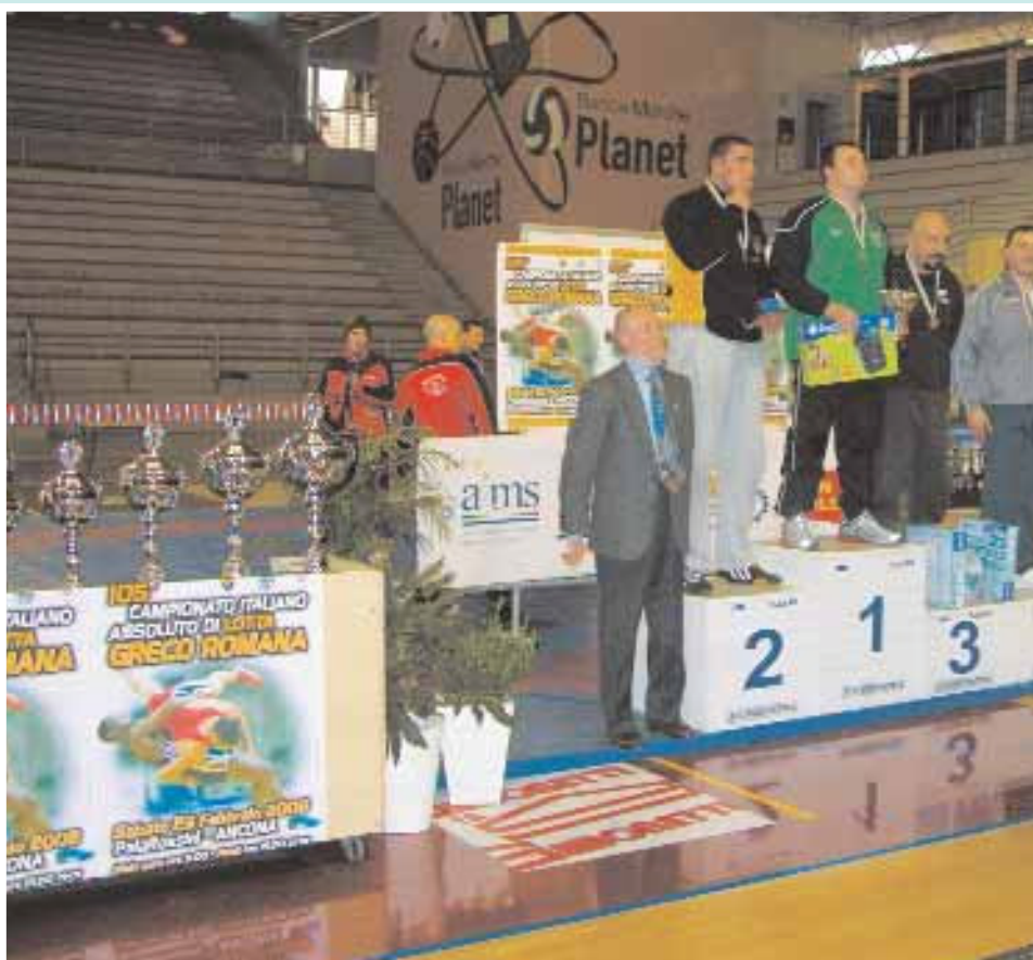
▲ podio dei kg 120