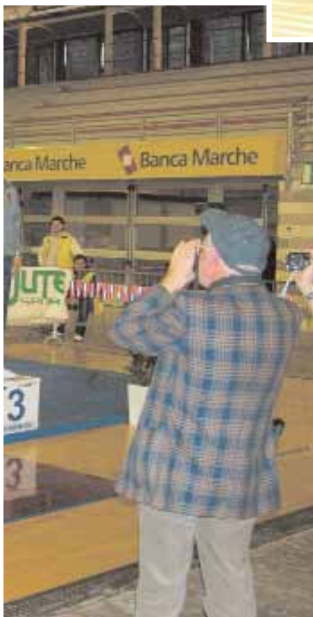
podio dei kg 74 ▶