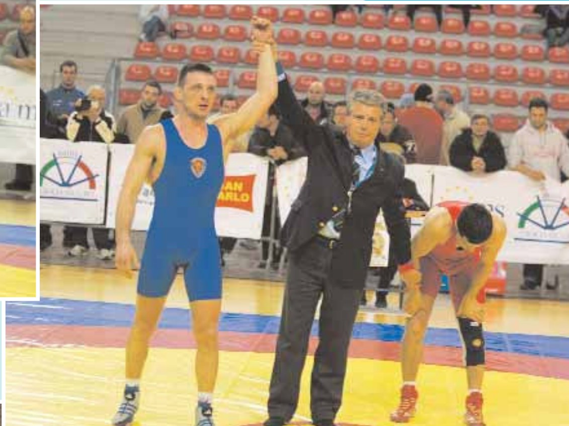
▲ kg 60 Fucile-Magni