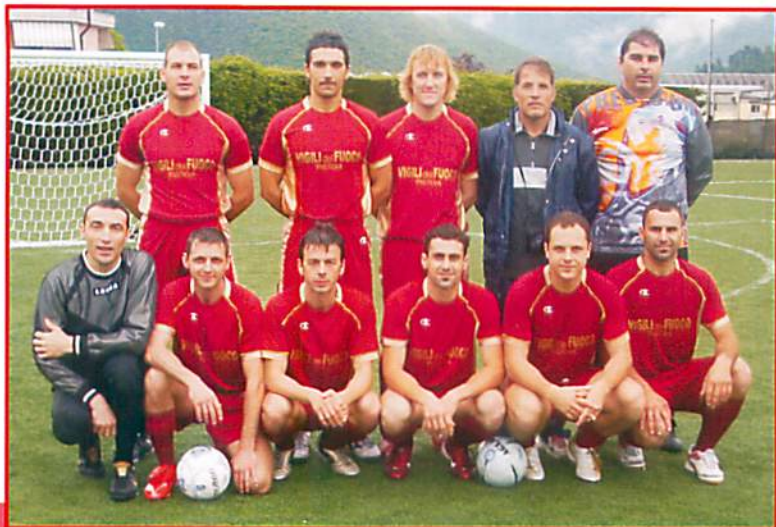
RAPPRESENTATIVA VV.F. TOSCANA 2008