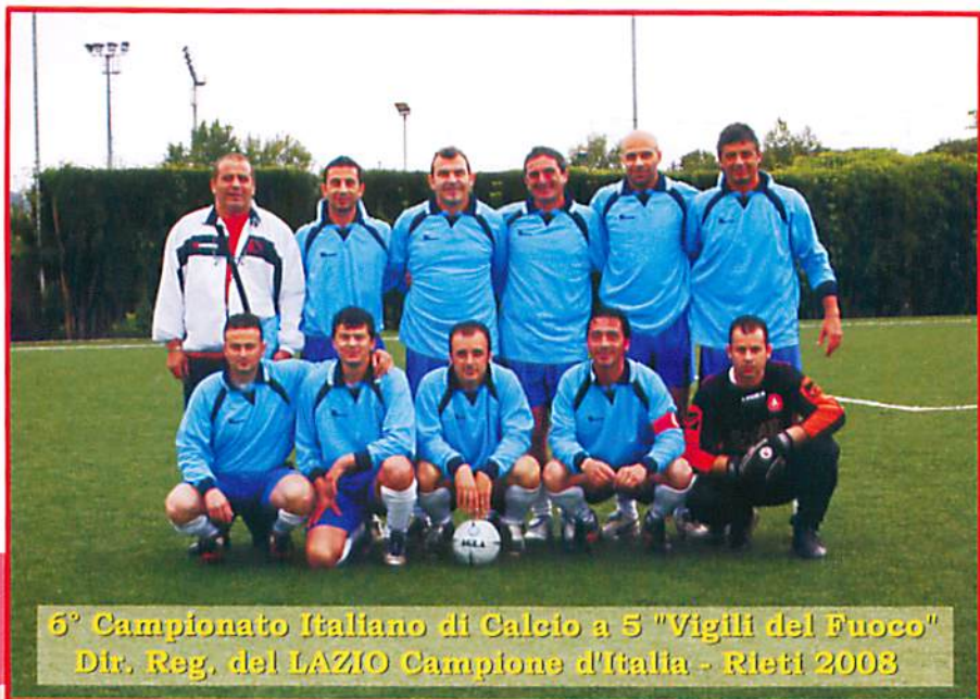
6° Campionato Italiano di Calcio a 5 "Vigili del Fuoco" Dir. Reg. del LAZIO Campione d'Italia - Rieti 2008