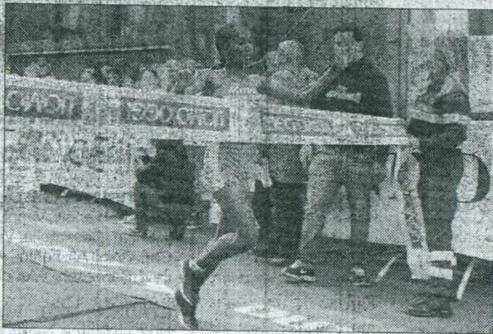
Bekele Abebek Abedeche Regina tra le donne

La gara di 21,097 chilometri, si è corsa nel centro e nell'immediata periferia della città, passando per La Pace e Staggiano e ha visto l'epilogo in via Roma. Una corsa combattuta che si è conclusa in volata. Protagonisti, all'altezza dei portici sono stati gli atleti kenioti ed etiopi. A spuntarla, per un solo secondo, uno dei