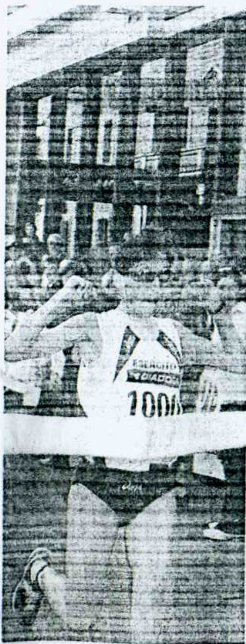
SICARI Vincitrice 2008

RECORD di iscritti alla 11ª edizione della Maratonina città di Arezzo. Circa 1200 gli atleti provenienti da ogni parte del mondo. Gli africani già oltrepassano le 30 unità e sarà molto difficile l'inserimento degli italiani nei primi 10, nonostante la presenza di Battocletti e Ricatti e forse l'arrivo in extremis dell'italo marocchino Mustafà che proprio domenica scorsa a Bucarest è giunto terzo con 1h03'07 sui 21.097 Km. In campo femminile etiopi, keniane e marocchine in prima fila mentre qualche italiana può entrare nelle prime 10. L'impegno organizzativo da parte della Polisportiva Policiano è notevole, ritrovandosi a dover allestire tutto o quasi soltanto nella mattinata di domenica, visti i divieti che l'amministrazione ha posto per alle-