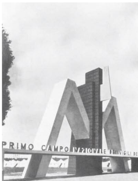
L'ingresso del 1° Campo Nazionale dei Vigili del Fuoco

In occasione della manifestazione a Piazza di Siena Mussolini commissionò all'artista toscano Benso Vignolini una statuetta in bronzo di Santa Barbara, protettrice dei Vigili del Fuoco, e successivamente Giombini ne ordinò 94 copie, da distribuire a ciascun Corpo provinciale. Vignolini modellò inoltre la medaglia-ricordo del 1° Campo Nazionale, 60 mm di diametro, coniata in bronzo dalla ditta Lorioli di Milano. Sul dritto risalta il profilo del duce con intorno la scritta 1° Campo Nazionale – Roma 24 giu-