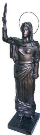
La Santa Barbara di Benso Vignolini

Individuata l'area, redatto il progetto e assegnato l'appalto, i lavori furono completati «con rapidità fascista» in appena nove mesi. Il duce, accompagnato da Buffarini-Guidi e da Giombini, poté inaugurare il complesso il 4 agosto 1941.