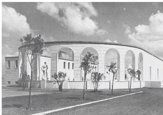
L'esterno dello "stadio nautico"

turale lucidato. Non potevano mancare l'infermeria e un "bagno finnico". Il blocco piscina-palestra era rivestito da travertino di Tivoli con cornici in peperino di Viterbo. Nel 1948 Ortensi presentò i disegni dello "stadio nautico" e dell'annessa palestra alla 3a Mostra d'Arte ispirata allo Sport, che si tenne alla GNAM di Roma.