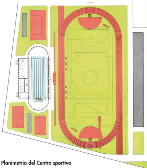
Planimetria del Centro sportivo

lunghi, dalla palestra (50 x 12,50 m, come la vasca) e da una parete bucata da cinque aperture sul prospetto principale verso il campo di calcio. I fianchi formavano due esedre del diametro di 25 metri con undici arcate ciascuna, cinque delle quali incorniciavano delle statue. La piscina non sfuggiva alle forti suggestioni del Canopo di Villa Adriana e della natatio delle terme imperiali. L'edificio della palestra disponeva di sale per la lotta e il sollevamento pesi, il pugilato, la scherma, la pallacanestro, con pavimento in suberit ; lo spogliatoio era in rovere na-