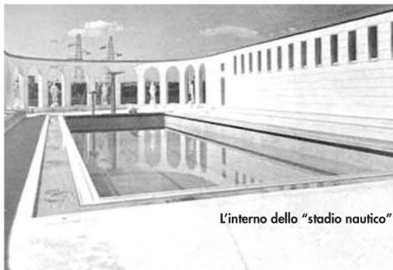
L'interno dello "stadio nautico"

quelle di una conformazione architettonica quanto mai pregevole ed equilibrata: l'impostazione urbanistica è semplice ed organica; la composizione è moderna senza eccessi, quadrata nella sua tessitura fondamentalmente classica, schietta, linda, con quel tanto di monumentalità che è necessario e compatibile in un edificio del genere. Trattasi, insomma, di una delle opere del regime più nobilmente concepite di quante sono state recentemente realizzate».