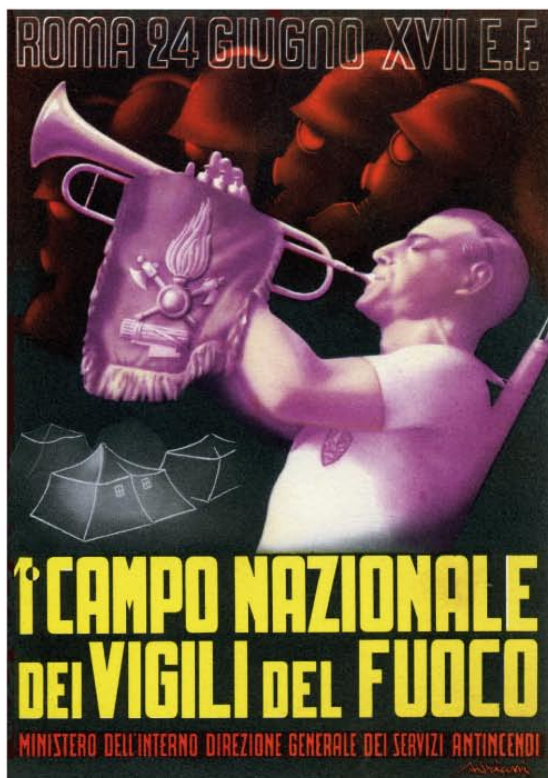
Il manifesto del 1° Campo Nazionale dei Vigili del Fuoco

gno XVII EF. Sul rovescio è rappresentata Santa Barbara a figura intera, con i classici simboli che l'accompagnano: la torre e la fronda di palma. Sullo sfondo compare il Colosseo; intorno è la scritta a rilievo Corpo Naz.le Vigili del Fuoco . Si conosce anche una seconda versione della medaglia, che si differenzia dalla precedente nel diametro, 30 mm, e nell'immagine del rovescio, ove lo stemma dei Vigili sostituisce la santa protettrice.