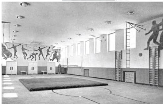
L'interno della palestra

quelle di una conformazione architettonica quanto mai pregevole ed equilibrata: l'impostazione urbanistica è semplice ed organica; la composizione è moderna senza eccessi, quadrata nella sua tessitura fondamentalmente classica, schietta, linda, con quel tanto di monumentalità che è necessario e compatibile in un edificio del genere. Trattasi, insomma, di una delle opere del regime più nobilmente concepite di quante sono state recentemente realizzate».