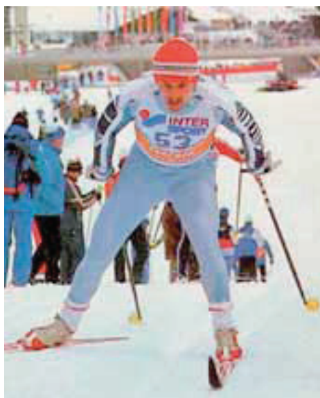
Qui sopra, Maurilio De Zolt, considerato uno dei migliori fondisti italiani, vincitore della medaglia d'oro nella 50 km al Mondiale di Oberstdorf, nel 1987.

coloro che sono in possesso dei requisiti previsti dal regolamento non fossero sufficienti a coprire la disponibilità dei posti, allora si dovrà necessariamente allargare l'orizzonte anche ad altre discipline sportive, soprattutto se espressione di atleti di alto livello in grado di rafforzare la già prestigiosa immagine del Corpo nazionale dei Vigili del fuoco. L'obiettivo che almeno uno di essi possa rappresentare l'Italia e il Corpo alle prossime Olimpiadi estive di Rio de Janeiro (2016) o in quelle invernali di Pyeongchang (2018) appare quasi impossibile da raggiungere se consideriamo che, al momento, il 98 % degli atleti italiani inseriti nel Club olimpico del Coni che probabilmente parteciperanno alle prime ed