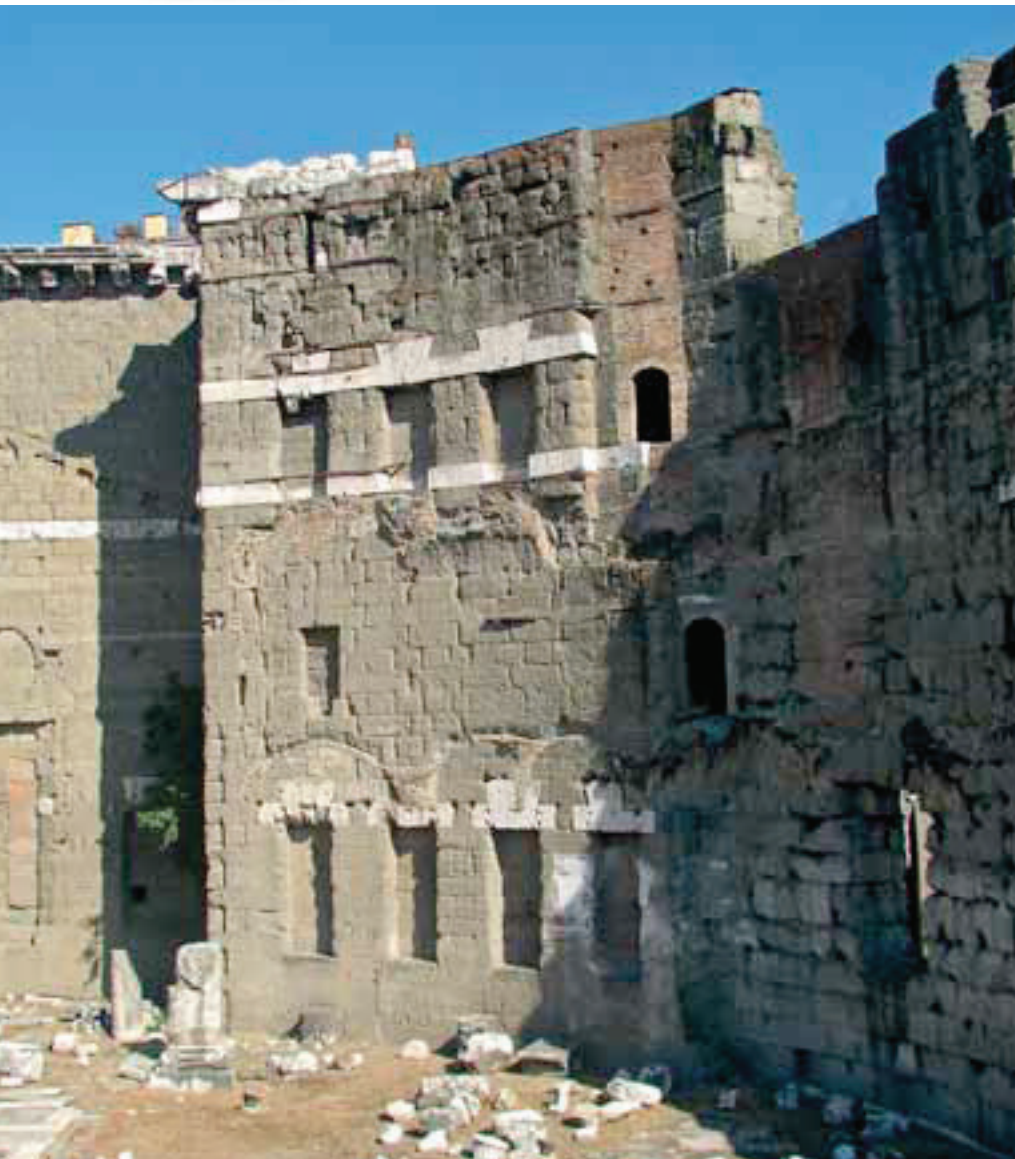
Roma, Foro di Augusto. Il grande muro tagliafuoco tra i Fori imperiali e la Suburra, I secolo a.C. Particolare del nicchione sud-est.

niana questo stesso stratagemma fu appunto ripreso in maniera sistematica nei tempi successivi. Non è un caso se, ancora a Pompei, che nel medesimo periodo era già tutta edificata, fino alla sua distruzione per l'eruzione del Vesuvio del 79 d.C. i muri doppi in questione nei tanti casi di unità abitative contigue non sembrano mai impiegati, se non forse tra due sole domus lungo il vicolo della Regina ai margini dell'abitato sud tra la piazza del Foro maggiore e il Foro triangolare ( Regio VIII, insula 2 ).