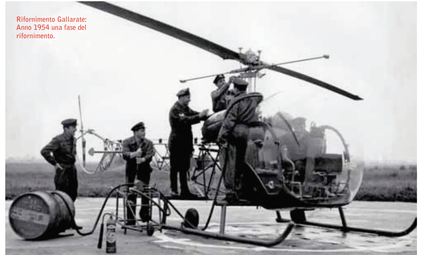
Rifornimento Gallarate: Anno 1954 una fase del rifornimento.