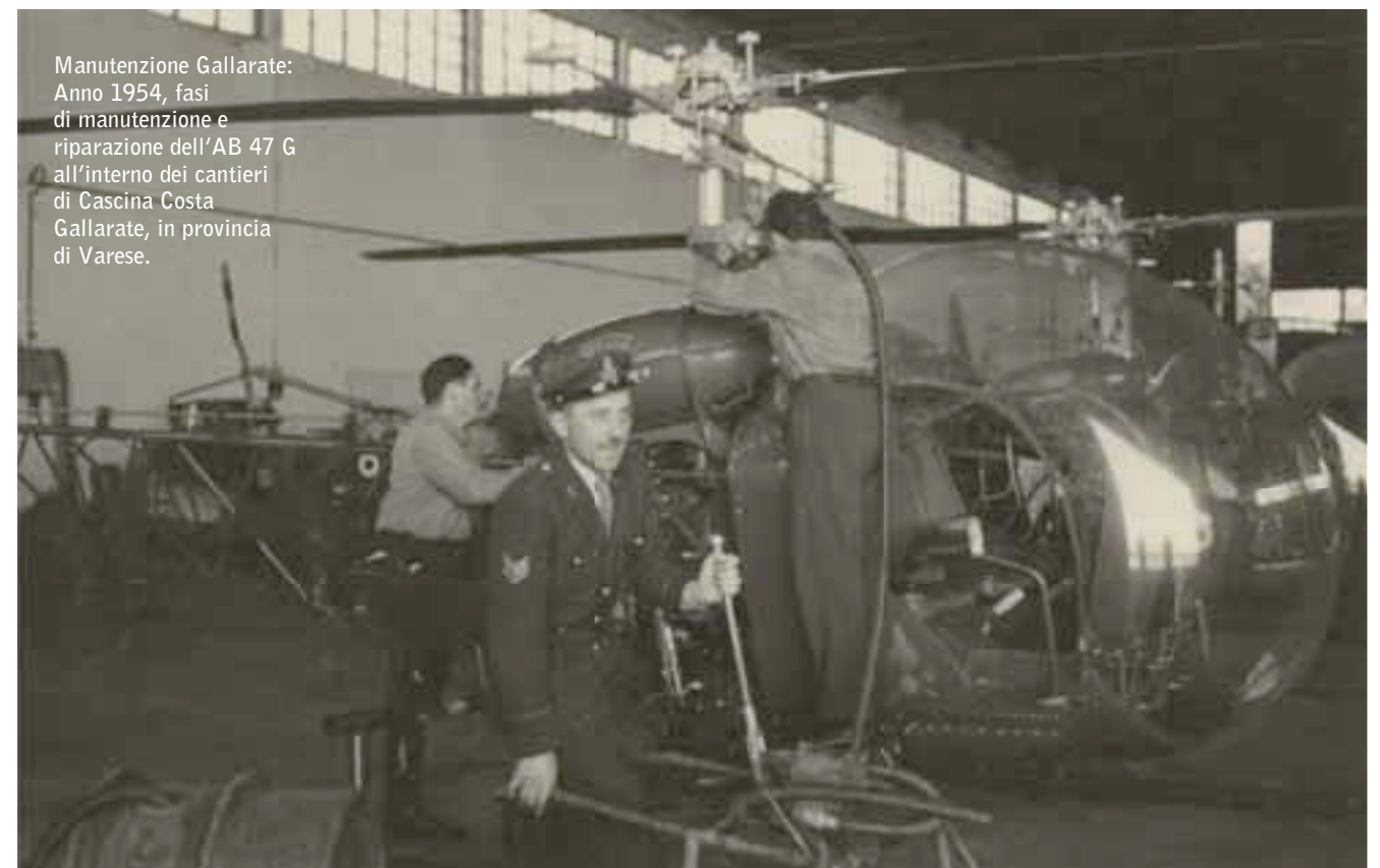
Manutenzione Gallarate: Anno 1954, fasi di manutenzione e riparazione dell'AB 47 G all'interno dei cantieri di Cascina Costa Gallarate, in provincia di Varese.