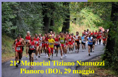
21° Memorial Tiziano Nannuzzi Pianoro (BO), 29 maggio