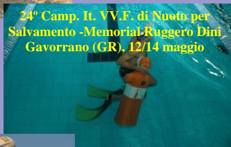
24° Camp. It. VV.F. di Nuoto per Salvamento - Memorial Ruggero Dini Gavorrano (GR), 12/14 maggio