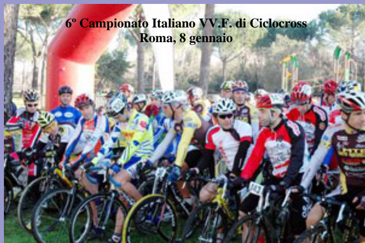
6° Campionato Italiano VV.F. di Ciclocross Roma, 8 gennaio