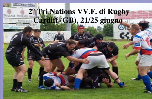
2° Tri Nations VV.F. di Rugby Cardiff (GB), 21/25 giugno