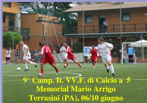
9° Camp. It. VV.F. di Calcio a 5 Memorial Mario Arrigo Terrasini (PA), 06/10 giugno