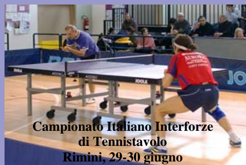
Campionato Italiano Interforze di Tennistavolo Rimini, 29-30 giugno