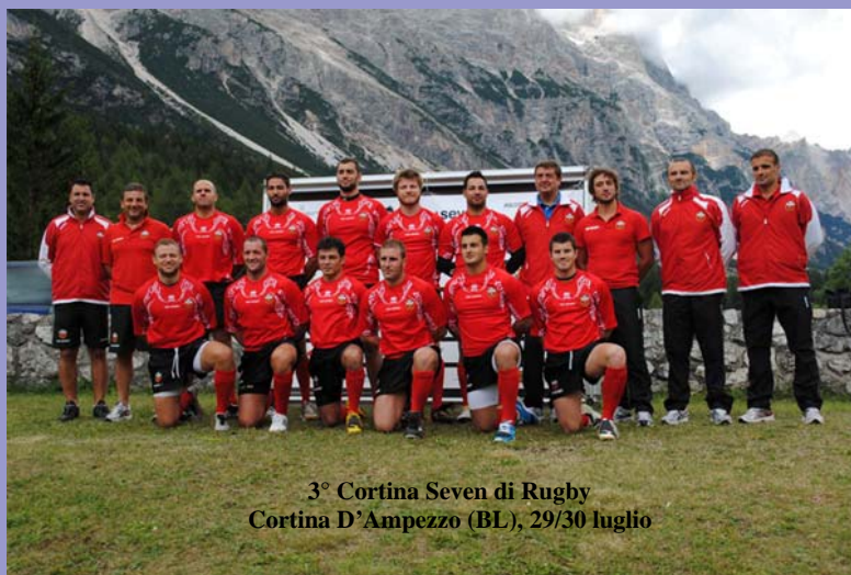
3° Cortina Seven di Rugby Cortina D'Ampezzo (BL), 29/30 luglio