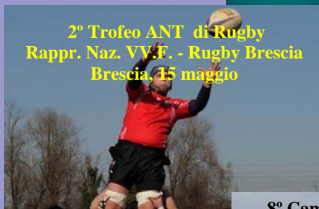
2° Trofeo ANT di Rugby Rappr. Naz. VV.F. - Rugby Brescia Brescia, 15 maggio