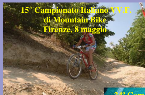
15° Campionato Italiano VV.F. di Mountain Bike Firenze, 8 maggio