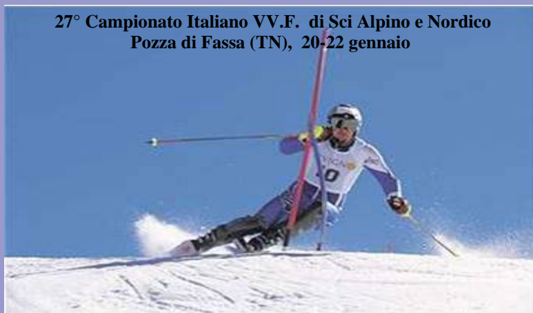
27° Campionato Italiano VV.F. di Sci Alpino e Nordico Pozza di Fassa (TN), 20-22 gennaio